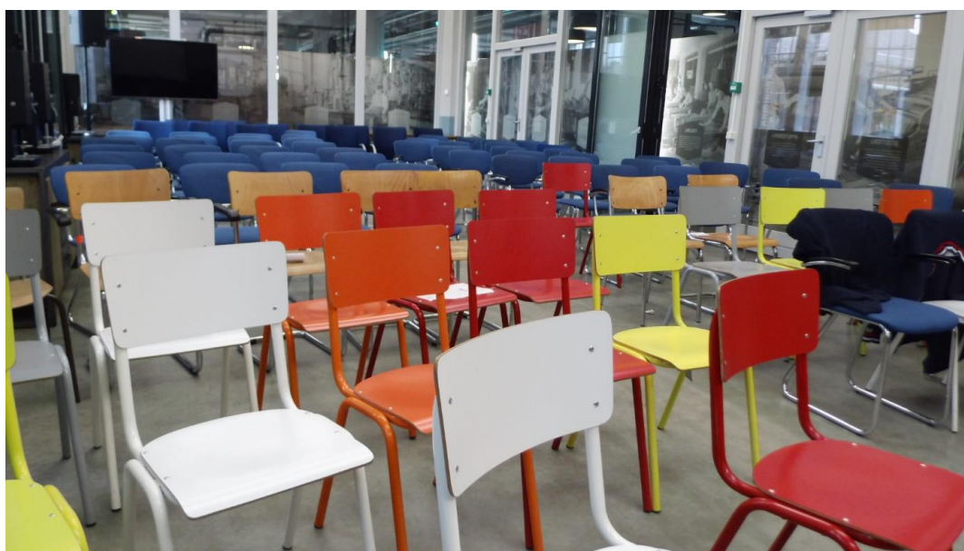
Al deze stoelen waren bezet op 16 september en 22 oktober. De strenge privacywet maakt het helaas niet mogelijk om gezichten van deelnemers te tonen.

De sheets van de presentatie van de Rabobank kunt u vinden op onze site. Ga naar www.vgcampina.nl , klik in de linker kolom op de dertiende regel met de tekst Themamiddagen waaronder dan de tekst Financiële planning voor ouderen, najaar 2019 verschijnt . Klik hierop en u kunt dan de presentatie en drie foto's openen.