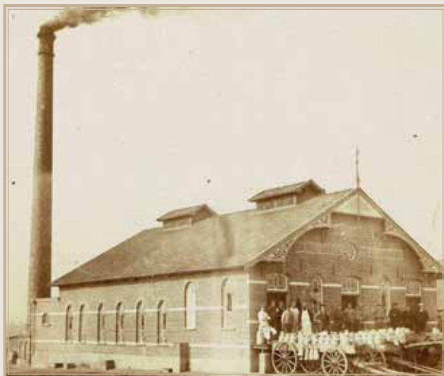
Fabriek 'Eendracht' te Silvolde, ca. 1910

Het boek 'Zuivelfabrieken kwamen en gingen' beschrijft de wordingsgeschiedenis van zuivelfabriekjes. Het is het resultaat van een onderzoek naar de achtergronden bij het ontstaan van de fabrieksmatige verwerking van melk in een groot deel van Gelderland. Hiervoor hebben model gestaan een 130-tal fabriekjes in een aaneengesloten gebied van de Achterhoek, Liemers en het Gelders Rivierengebied. Het beschrijft een fascinerend hoofdstuk uit de agrarische geschiedenis; de geleidelijke overgang van ambachtelijke zuivelbereiding naar industriële melkverwerking. Men ging iets nieuws beginnen! Men zal echter niet hebben kunnen vermoeden dat het proces, moeizaam begonnen, zou uitgroeien tot de huidige grootschalige verwerking van melk.