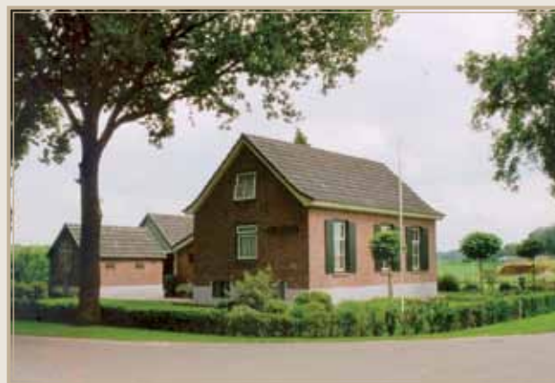
Het in 1909 gesloten handkrachtfabriekje te Barchem. Sindsdien omgevormd tot woning 'de Lijster' met nu nog alle kenmerken van het fabriekje. (foto 2004)