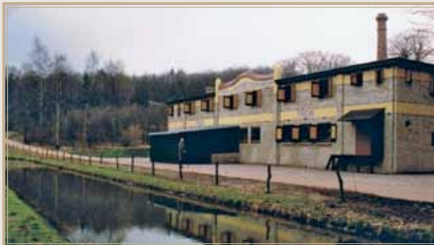
De 'Freia' in het openluchtmuseum (1992)

Een groot deel van het zuivelergoed is verdwenen. Toch is het fijn te constateren, dat op meerdere plaatsen in de regio de gebouwen nog zijn bewaard. Een bijzondere vorm van zuivelergoed is te zien in het Openluchtmuseum te Arnhem, waar de zuivelfabriek 'Freia' op 2 april 1992 begon aan haar tweede leven. Deze particuliere fabriek uit Veenwoude ging in september 1879 van start met de boterbereiding. Het is een toevallige coincidentie, dat de eerste melkinrichting te Arnhem haar activiteiten ook in dat jaar begon met de melkverwerking in de Kerkstraat aldaar. De oprichtingsakte – getekend 7 juli 1879 – vormde de basis op grond waarvan op 7 juli 2004 het Koninklijk predicaat werd toegekend aan Friesland Foods. Dit Koninklijk predicaat is nu overgegaan op FrieslandCampina, ontstaan door de fusie van de laatste twee grote zuivelcoöperaties in Nederland. Het erfgoed van de zuivel heeft daarmee een bijzondere relatie verkregen met Arnhem.