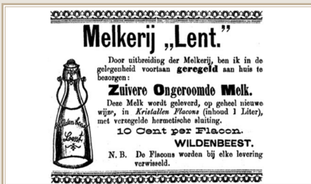
Advertentie mei 1890