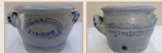
Keulse boterpotjes van de melkinrichtingen Arnhem en Nijmegen ca. 1900

De kennis van de ambachtelijke bereiding van boter en kaas beruiste op ervaring en werd steeds door de boerin doorgegeven. Eind negentiende eeuw kwam hierin een drastische verandering en ontstonden er op meerdere plaatsen melkinrichtingen en zuivelfabrieken. Het was het begin van een zeer dynamische periode voor de melkverwerking. In een relatief korte tijd kwamen in bijna elke stad of elk dorp zuivelfabrieken. De meeste van deze fabrieken waren binnen driekwart eeuw weer verdwenen. Het is nu bijna allemaal geschiedenis en de vraag is nu wat hiervan is vastgelegd. Tussen de komst van de eerste zuivelfabriekjes en de huidige zuivelindustrie ligt een proces van leren, investeren en saneren. De industriële verwerking van melk is begonnen in de periode van de landbouwcrisis eind 19e eeuw. Het was een periode waarin vele veranderingen werden ingezet. Achteraf kunnen die worden geduid als zijnde van groot belang, op zowel organisatorisch, economische als technisch vlak.