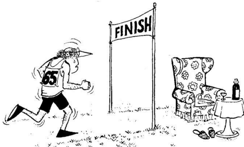
Inmiddels met een ander rugnummer!